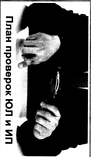
План проверок ЮЛ и ИП

Также особенности установлены постановлением Правительства Российской Федерации от 03.04.2020 № 438 «Об особенностях осуществления в 2020 году государственного контроля (надзора), муниципального контроля и о внесении изменений в пункт 7 Правил подготовки органами государственного контроля (надзора) и органами муниципального контроля ежегодных планов проведения плановых проверок юридических лиц и индивидуальных предпринимателей» (далее – Постановление № 438 В), которое вступило в силу 14.04.2020. Согласно Постановлению № 438 в 2020 году существенно расширены основания для проведения плановых и внеплановых проверок, а также расширены полномочия органов прокуратуры по согласованию проверок органов контроля.